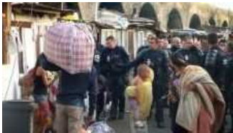
Des Roms sont évacués par des CRS, en juillet 2010, au campement du Hanul à Saint-Denis, le plus ancien d'Ile-de-France.