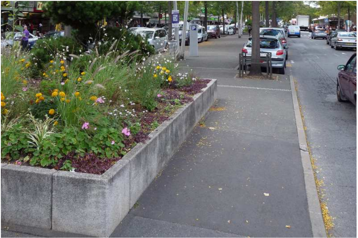
Des carrés de verdure agrémentaient l'îlot central, on pouvait s'asseoir sur le rebord pour discuter et passer un moment à l'ombre des grands arbres !... C'était possible encore l'été dernier !