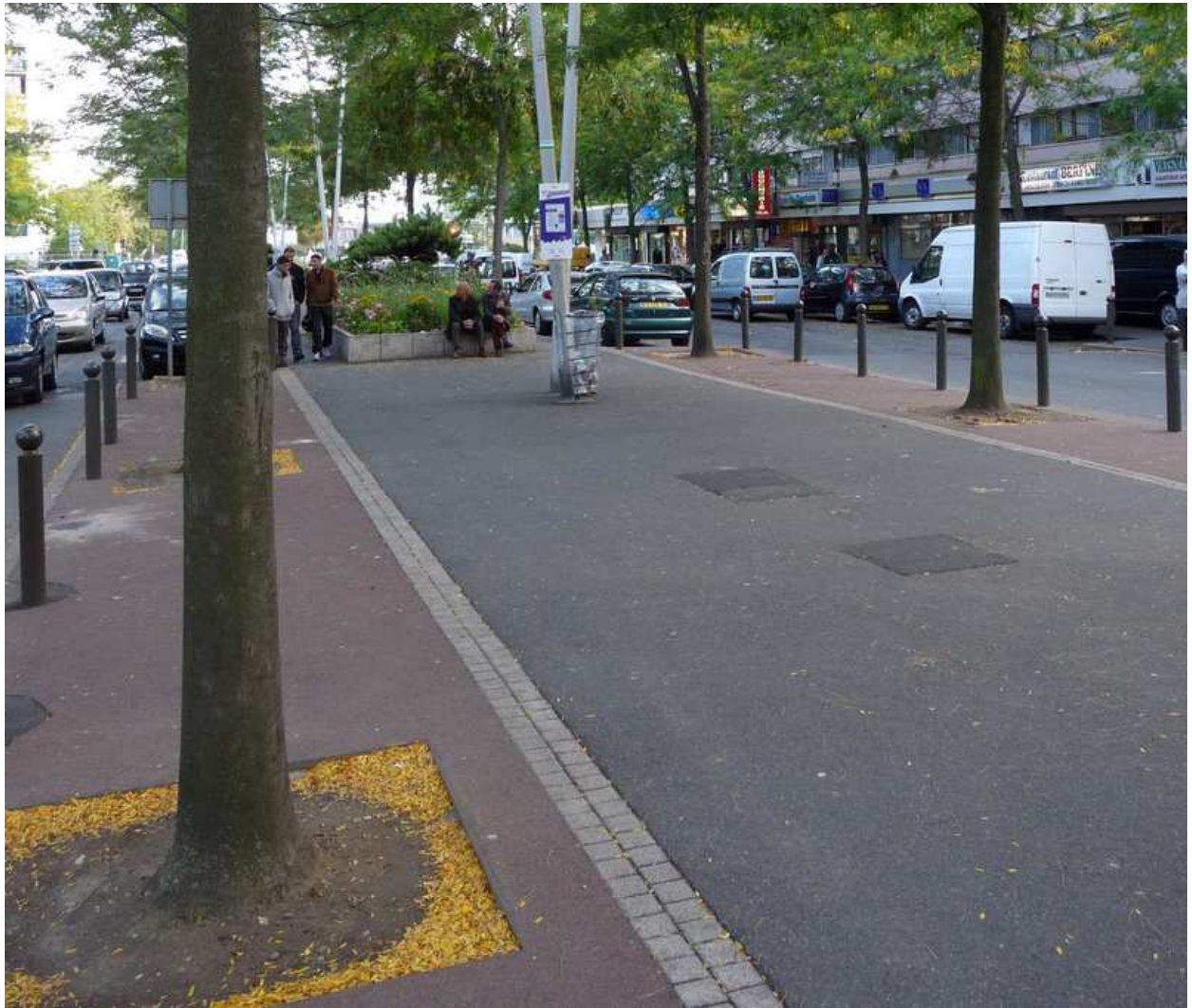
« Mon grand-père aimait bien retrouver ses amis et discuter à l'ombre des grands arbres bordés de plantations et de fleurs » réagit cette jeune fille du quartier qui regrette qu'une large place ait été faite aux voitures (cf. photos ci-après)