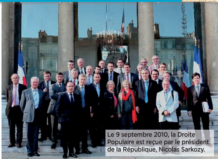
Le 9 septembre 2010, la Droite Populaire est reçue par le président de la République, Nicolas Sarkozy.

FRAUDER C'EST VOLER CELUI QUI FRAUDE SERA SANCTIONNÉ