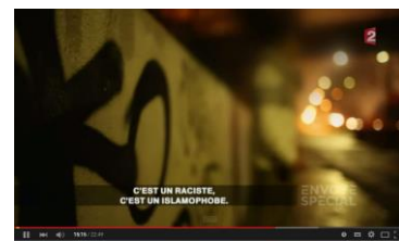
Enquête d'Envoyé Spécial sur le système Doucet

Et tout ça porqué ??? Pour eun'histoère eud'loyer qu't'aurais dit pendant la campagne électorale qu'c'était cadeau ou un truc comme ça qu'y n'n'a juste pour 90.000 euros (rien qu'pou'l'loyer mais y'a aussi aut'chose à s'qui paraît) ou à peu près et qu'finalement ça devrait ben s'trouver quèqu'part eun'somme pareille vu qu'si mes souvenirs sont bons ta réserve parlementaire a été versée à un collectif d'associations, s'qui t'a permis d'pas donner l'détail. P'têt'ben qui reste des sous quèqu'part...va savère...même si d'puis l'temps ça m'étonnerait.