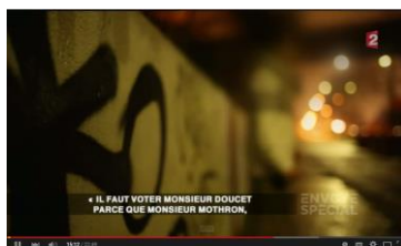
Enquête d'Envoyé Spécial sur le système Doucet