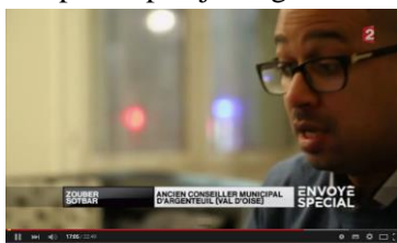
Enquête d'Envoyé Spécial sur le système Doucet

Et c'était qu'un début !!! Figure té qu'y z'ont même interviewé un gars ( celui du "cabinet" j'crès ben.) et que c'est pas trop la joie. 'gad'don !!