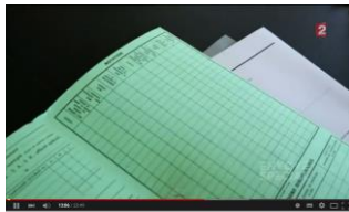
Enquête d'Envoyé Spécial sur le système Doucet

Et c'était que l'apéro !!! Pasque l'21, ( deux jours après ) ça a pas rigolé non plus !!! Il a acco été question d'nous...enfin surtout choc des photos mon d'té. Là, j'cause même pas !! Le gars. Comme on dit ailleurs !! T'as vu ??? T'as ton système !!!